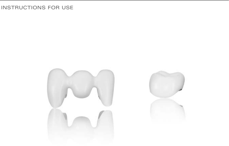
73291 West 1105 Printed in Sweden. Date of issue 2011-03-29.